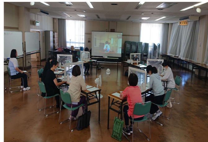
「1中校区」、「2・3中校区」での様子

■既に開催された1中、2・3中では参加者様の活発な意見交換が行われました。今後の日程については下記の通り予定しています。