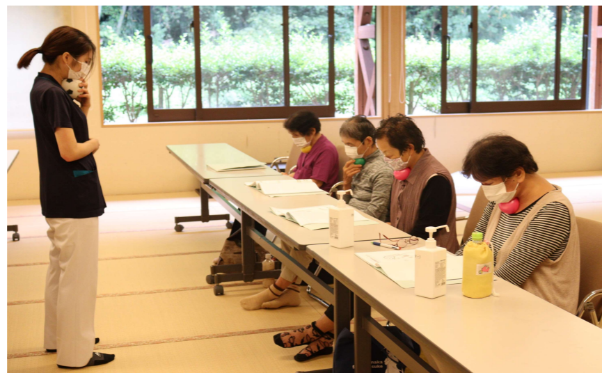
理学療法士、言語聴覚士による個別指導の様子