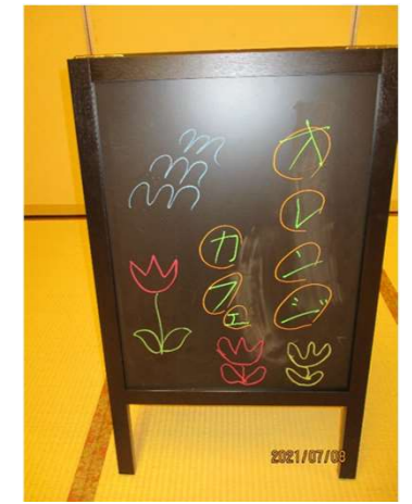
当事者の方が作成した看板です